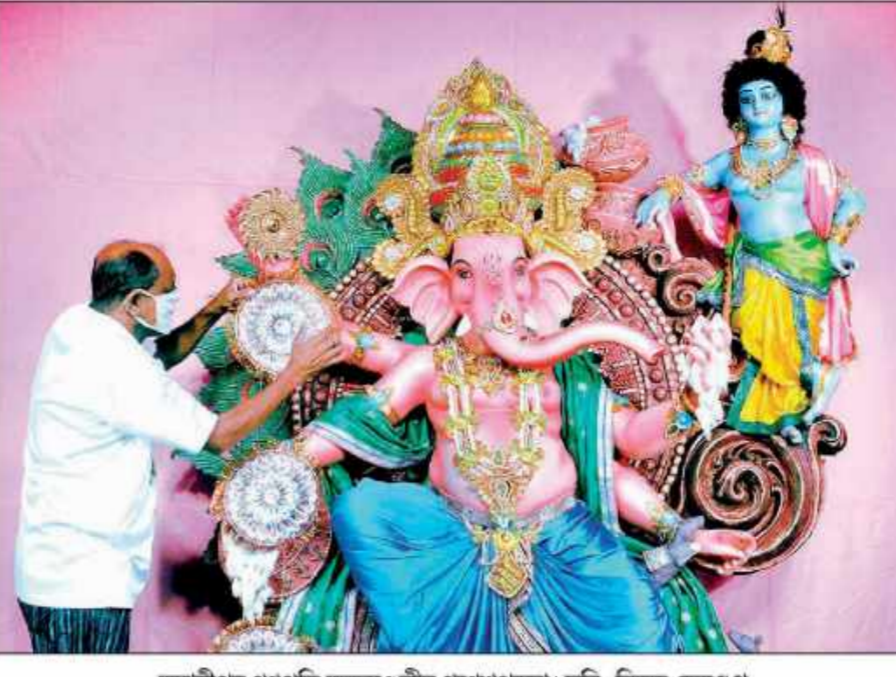
ভবানীপুর গণপতি ভক্তমণ্ডলীর গণেশপূজা।

প্রদেহ উত্তরে নীলাঞ্জনা অসংলগ্ন কিছু তথ্য দিয়েছেন। পুলিশ ওই দেহ তুলে ময়নাতদন্তে পাঠায়। ঘরের ভেতর জিনিসপত্র ছড়ানো হেটমো ছিল। আওয়ালো ঘরেই তার দীর্ঘদিন থাকতেন বলে মনে করছে পুলিশ। রবিনসন স্ট্রিটেও পার্থ দে দিদির দেহ আগলে রেখেছিলেন। একটি ঘটনার তদন্তে যাওয়ার পরেই পুলিশ জানতে পারে, মৃত দিদির দেহ আগলে রেখেছিলেন পার্থ দে। সরস্বতা কাণ্ডে ওই বাণীর জীবিত আর কেউ আছেন কি না তার খোঁজ করছে পুলিশ। বাড়িটি তাল্লা দিয়ে রাখা হয়েছে। মৃত রবীন্দ্রনাথবাণ্যর আধার কার্ডের তথ্য অনুযায়ী ১৯৩৩ সালে জন্মগ্রহণ করেছেন। তিনি পেশায় কী করতেন বা নীলাঞ্জনা কী করেন, স্থানীয় সূত্রে পুলিশ সেসব জানার চেষ্টা করছে। নীলাঞ্জনার মা ও দাদার মৃত্যুর পর দেহ আগলে রাখার ঘটনা ঘটেছিল। সেই সূত্রেই এদিনও পড়া গল্প পেয়ে সন্দেহ হয় প্রতিবেশীদের। পরে তারা ভাঙা ভাঙা করে, বাবার দেহও আগলে রেখেছিলেন নীলাঞ্জনা।